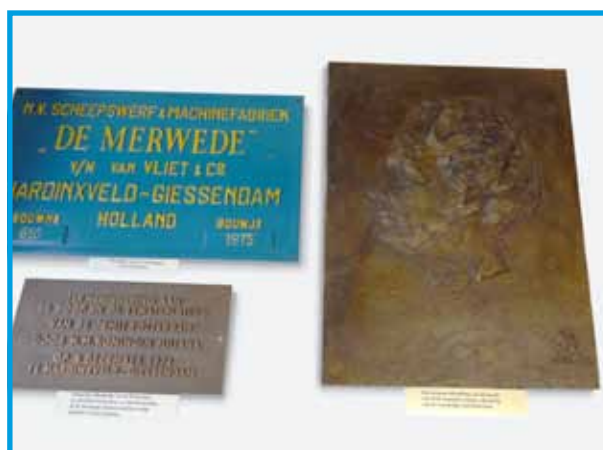
De plaquette en de werfplaat van de Smit Rotterdam

In het bijzonder zijn we erg blij met het bronzen portret van HM Koningin Juliana, dat vanaf het