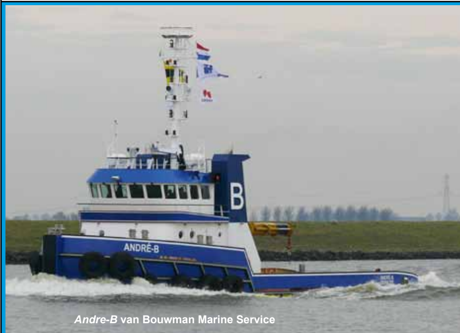
Andre-B van Bouwman Marine Service

tentoonstellingen de nadruk gelegen op de traditionele zeesleepvaartrederijen van nu en van weleer. Daarin willen we verandering brengen met de komende expositie. Wat velen zich niet realiseren is dat de sleepvaartwereld van nu niet meer alleen draait om Smit (is nu onderdeel van Boskalis), Wijsmuller (is overgenomen door Svitzer) of Doeksen (is nu uitsluitend veerbootrederij). Er zijn heel veel rederijen bijgekomen in Nederland, zonder dat het grote publiek, onze bezoekers dus, dat eigenlijk in de gaten heeft. Andere reeds bestaande rederijen zijn soms mèt, maar meestal zonder veel publiciteit uitgegroeid tot betekenisvolle